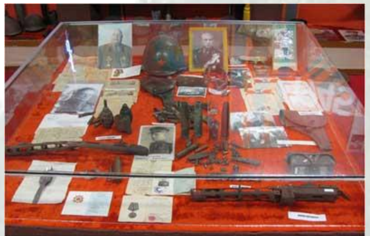
«Краснопольщина после войны»